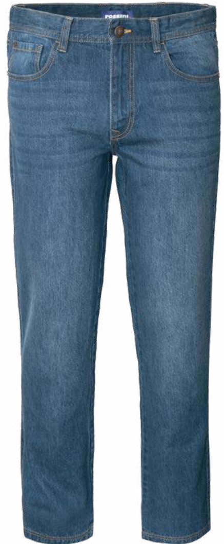
01 - BLU 01 - BLUE