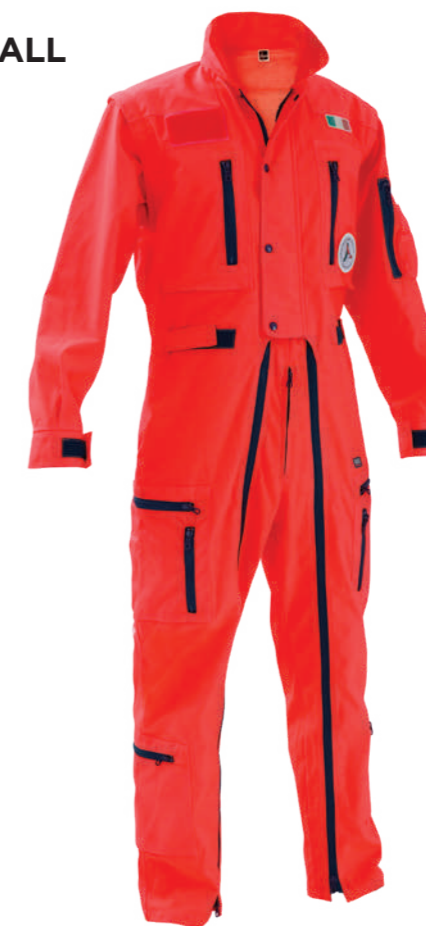
rosso / red 2006

Realizzato con tessuto conforme alla UNI EN ISO 4920:2013 (Resi- stenza alla bagnatura superficiale, idrorepel- lenza) con indice di ba- gnabilità ISO 5 - massi- ma idrorepellenza. Made with fabric com- pliant to UNI EN ISO 4920:2013 (Determina- tion of resistance to sur- face wetting) with per- formance indicator ISO 5 - maximum waterproof.