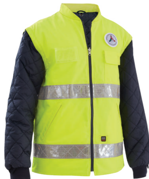
giallo-blu / yellow-blue 0700

Zip reversibile predispo- sta all'aggancio del giac- cone Reverse zip for fastening the parka