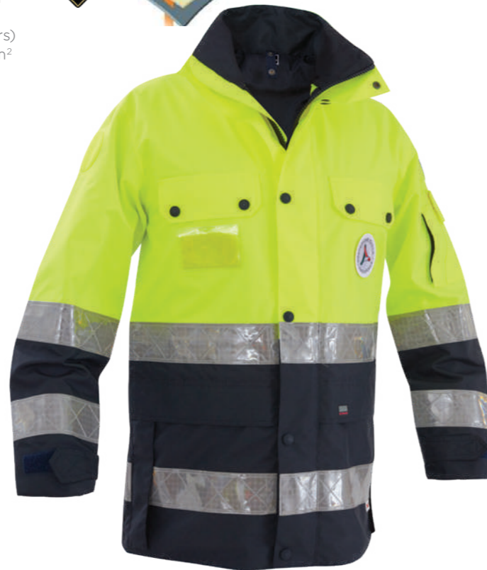
giallo-blu / yellow-blue 0700