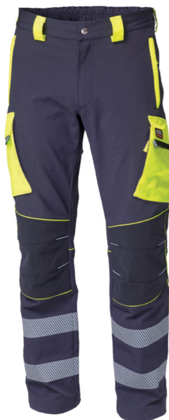
blu-giallo / blue-yellow 4086

Tasca con zip sulla manica sinistra Pocket with zip on the left sleeve