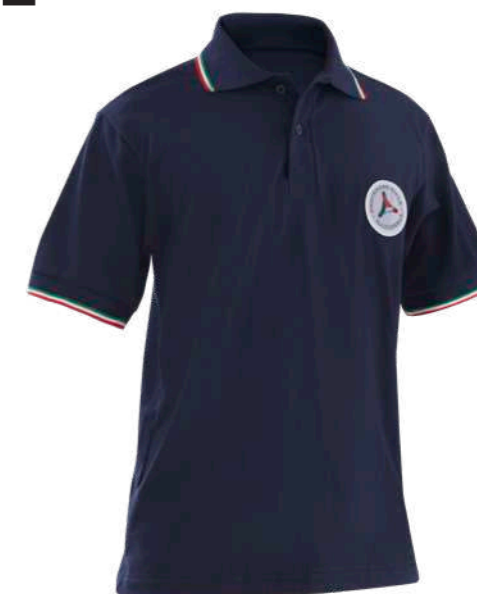
blu / blue 4034

DPI di 1° categoria per rischi minimi UNI EN ISO 13688:2022