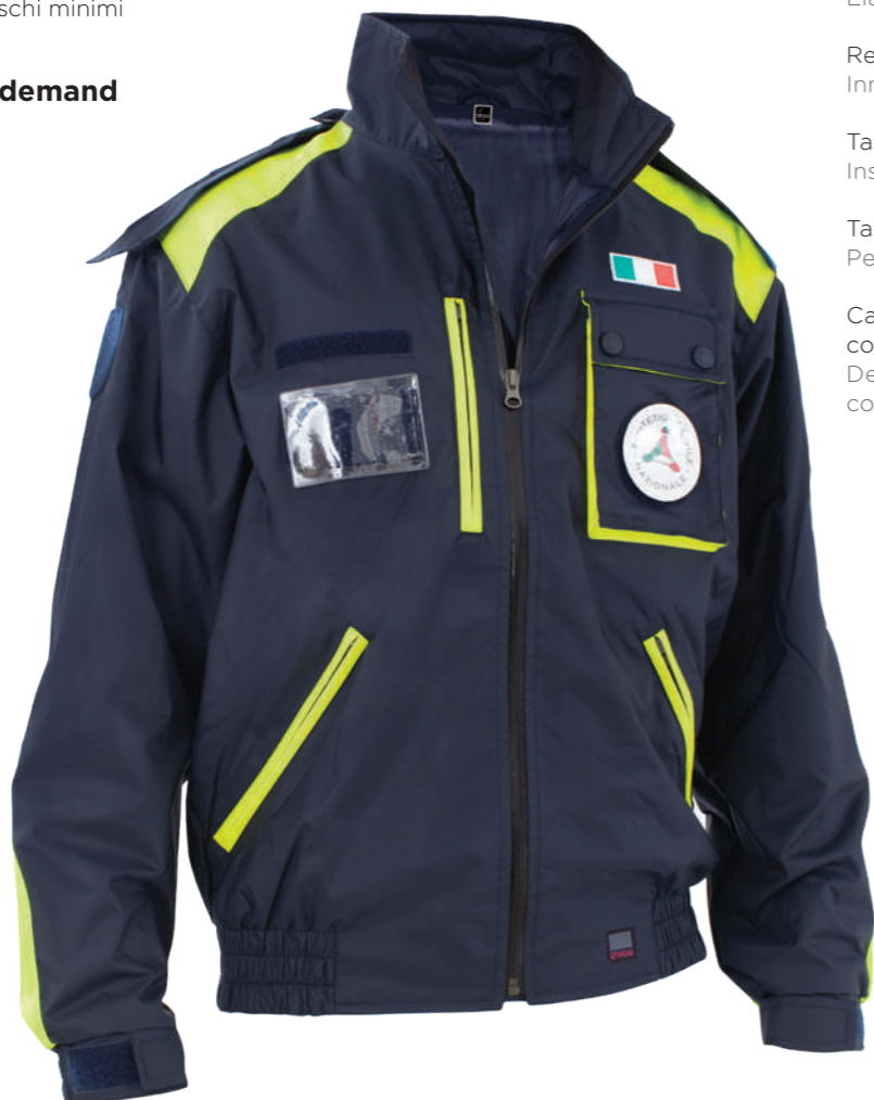
blu / blue 0700