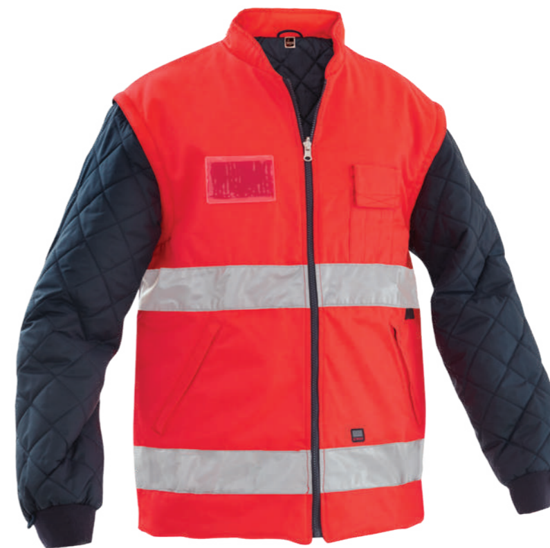
rosso / red 2006