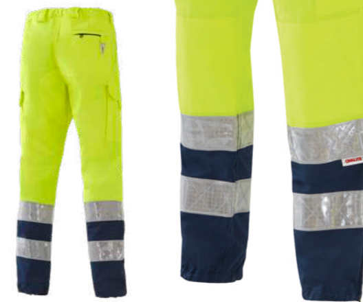
giallo-blu / yellow-blue 0700

Realizzato con tessuto conforme alla UNI EN ISO 4920:2013 (Resistenza alla bagnatura superficiale, idrorepellenza) con indice di bagnabilità ISO 5 - massima idrorepellenza. Made with fabric compliant to UNI EN ISO 4920:2013 (Determination of resistance to surface wetting) with performance indicator ISO 5 - maximum waterproof.