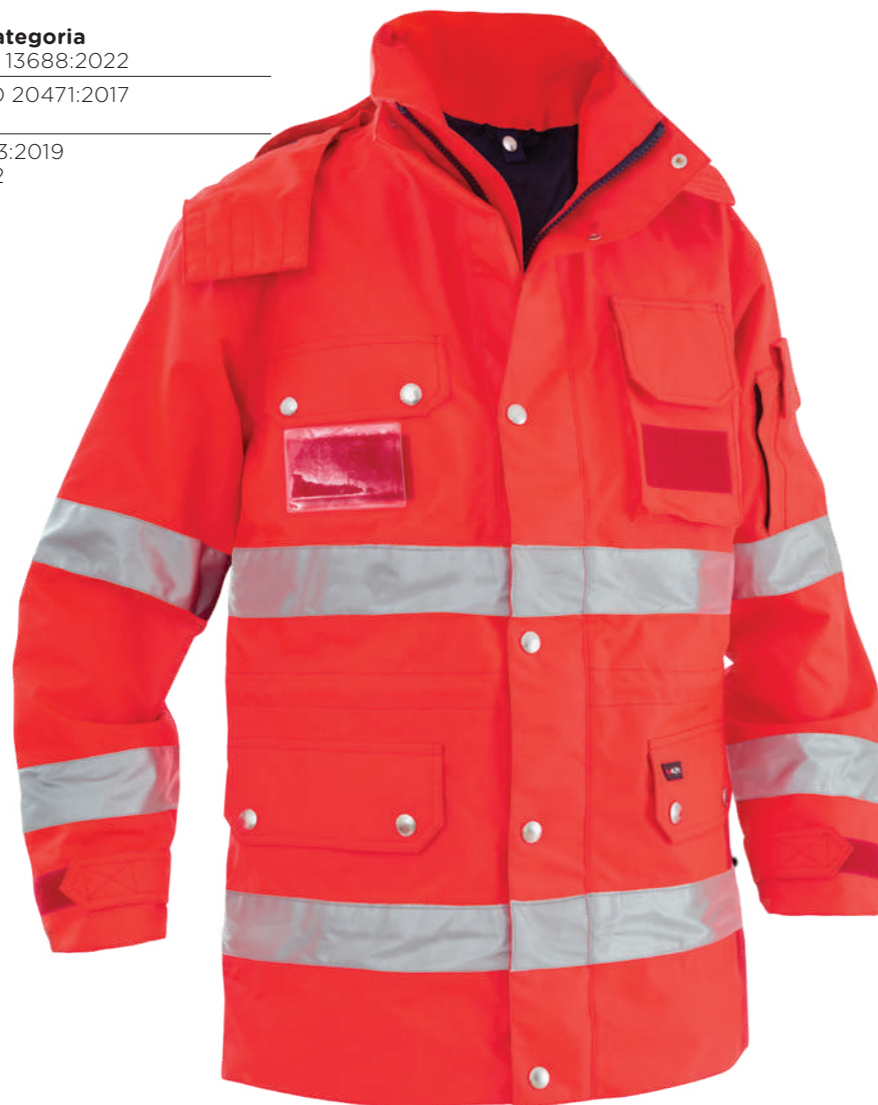
rosso / red 2006