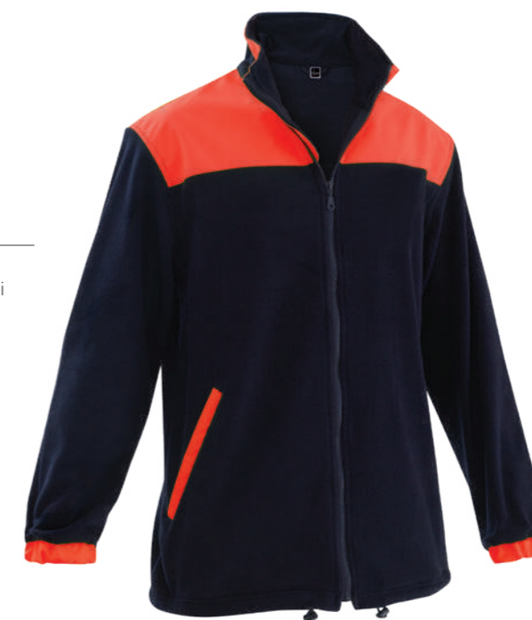
blu / blue 4007