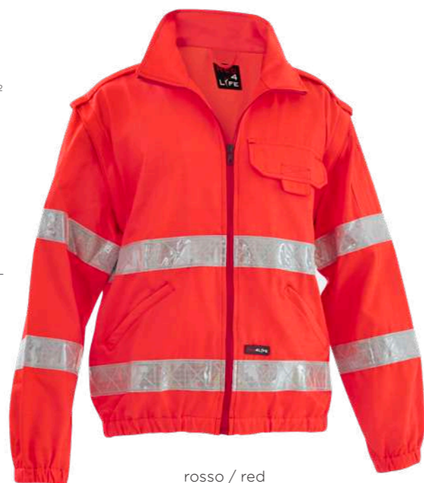
rosso / red 2006

UNI EN ISO 20471:2017 CLASSE 1 (senza maniche)