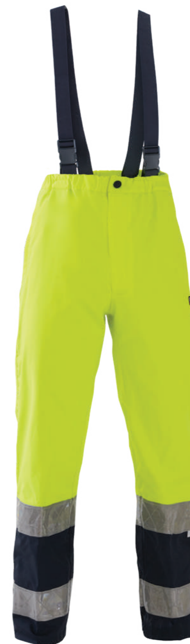
giallo-blu / yellow-blue 0700