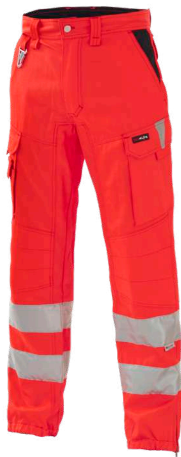
rosso / red 2006

CE DPI di 2° categoria UNI EN ISO 13688:2013