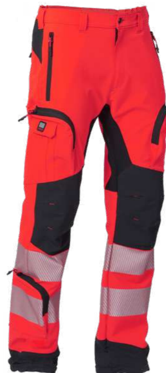
rosso / red 2708

Apertura con zip e bottone Opening with zipper and button