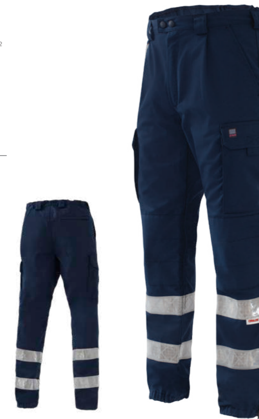
blu / blue 4007

Rinforzi ginocchia e dietro Reinforced knees