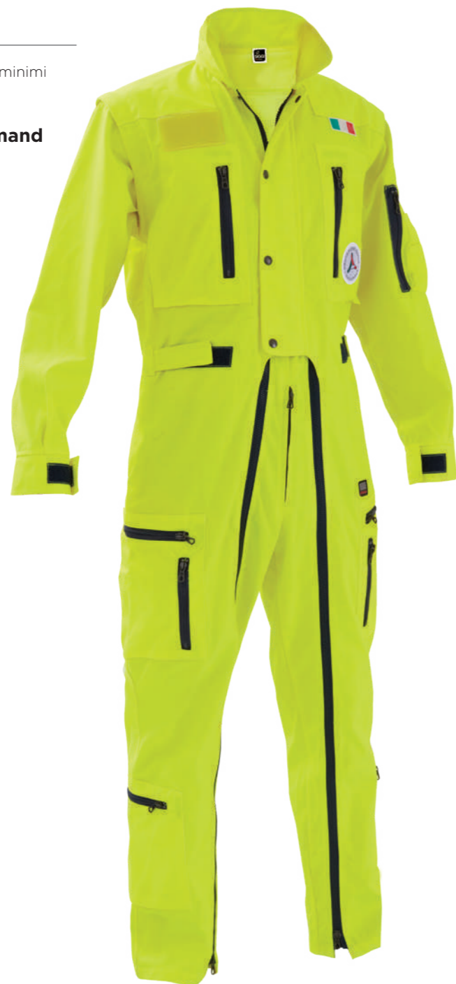
giallo / yellow 0019

Realizzato con tessuto conforme alla UNI EN ISO 4920:2013 (Resistenza alla bagnatura superficiale, idrorepellenza) con indice di bagnabilità ISO 5 - massima idrorepellenza. Made with fabric compliant to UNI EN ISO 4920:2013 (Determination of resistance to surface wetting) with performance indicator ISO 5 - maximum waterproof.