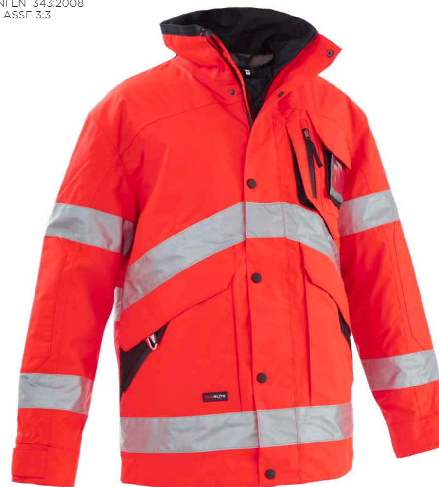
rosso / red 2006

Chiusura con zip e bot- toni a pressione Zip closure with snap buttons