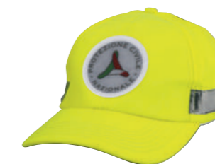
giallo / yellow 0019