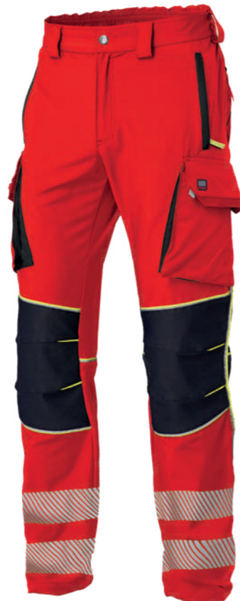
rosso / red 2708

UNI EN ISO 20471:2017 CLASSE 3 (a completo con 07GB0403)