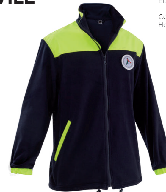
blu / blue 4701

DPI di 1° categoria per rischi minimi UNI EN ISO 13688:2022