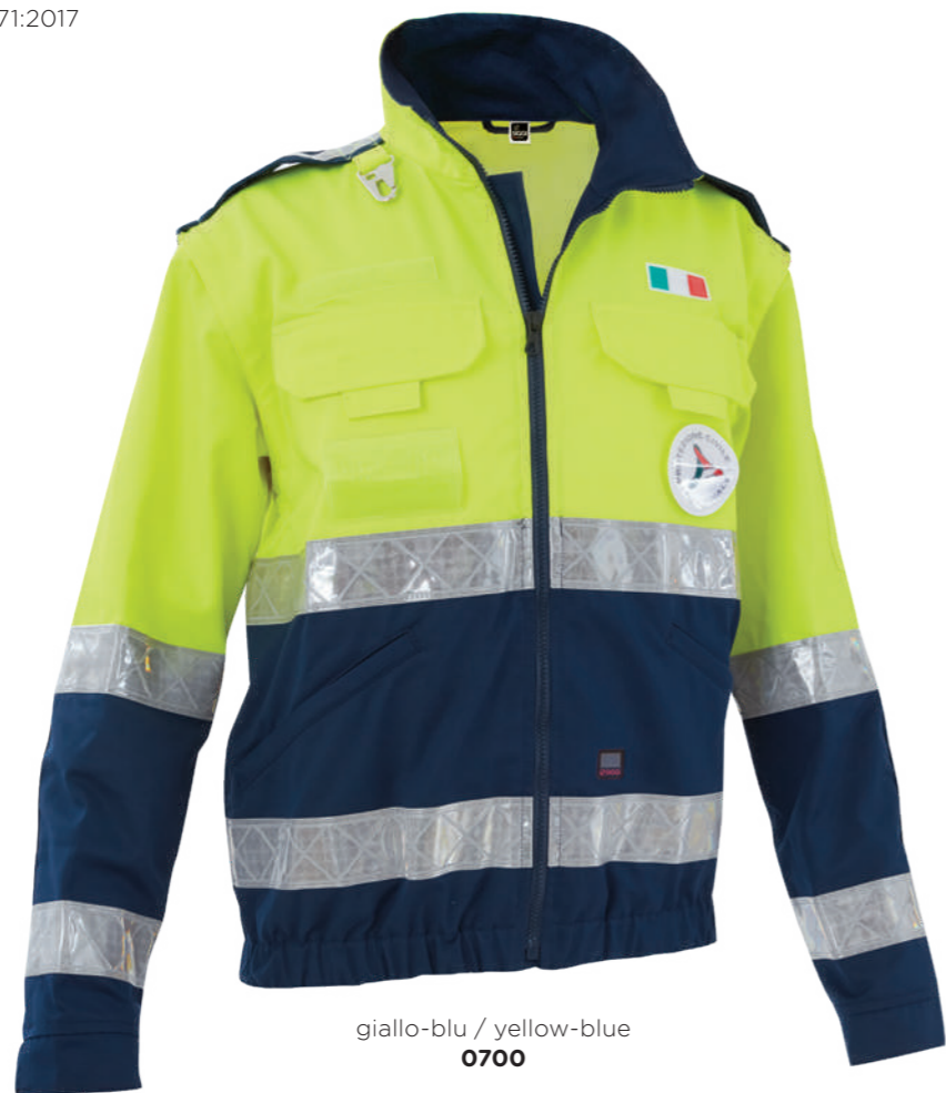
giallo-blu / yellow-blue 0700

Realizzato con tessuto conforme alla UNI EN ISO 4920:2013 (Resistenza alla bagnatura superficiale, idrorepellenza) con indice di bagnabilità ISO 5 - massima idrorepellenza. Made with fabric compliant to UNI EN ISO 4920:2013 (Determination of resistance to surface wetting) with performance indicator ISO 5 - maximum waterproof.