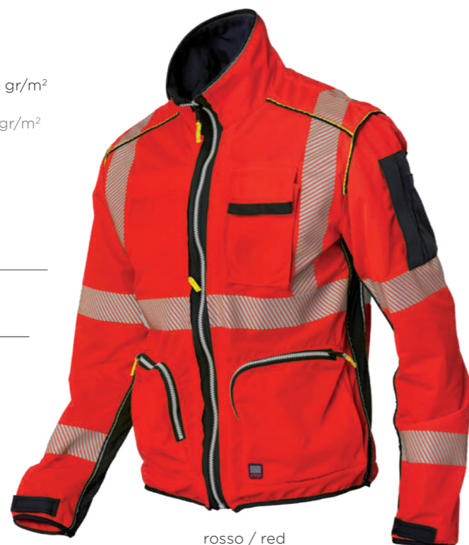
rosso / red 2708

UNI EN ISO 20471:2017 CLASSE 3 (a completo con 07PA0958)