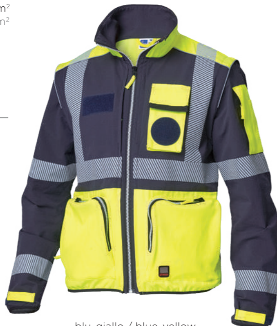
blu-giallo / blue-yellow 4086