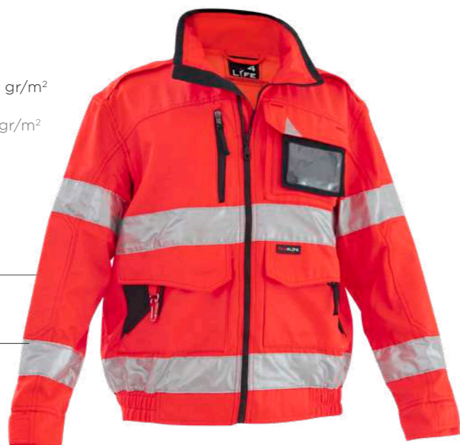
rosso / red 2006