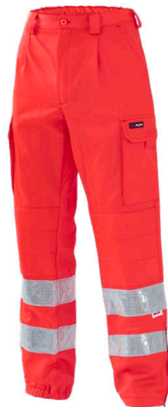
rosso / red 2006

Rinforzi ginocchia e dietro Reinforced knees