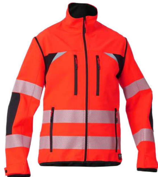
rosso / red 2708

Maniche staccabili con zip rovesciata Detachable sleeves with reverse zippers